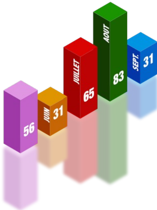
Moyenne mensuelle des visites quotidiennes

L'année 2023 aura été exceptionnelle, en grande partie grâce à l'exposition et au film sur François Bourgeon, qui ont drainé un large public.