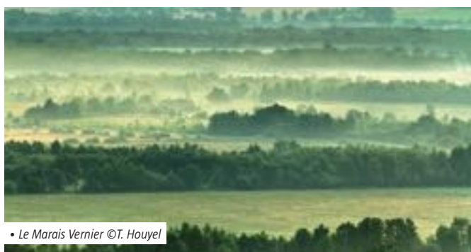
• Le Marais Vernier

L'implication forte des élus garantit la pérennité et la capacité de mobilisation du projet Ramsar.