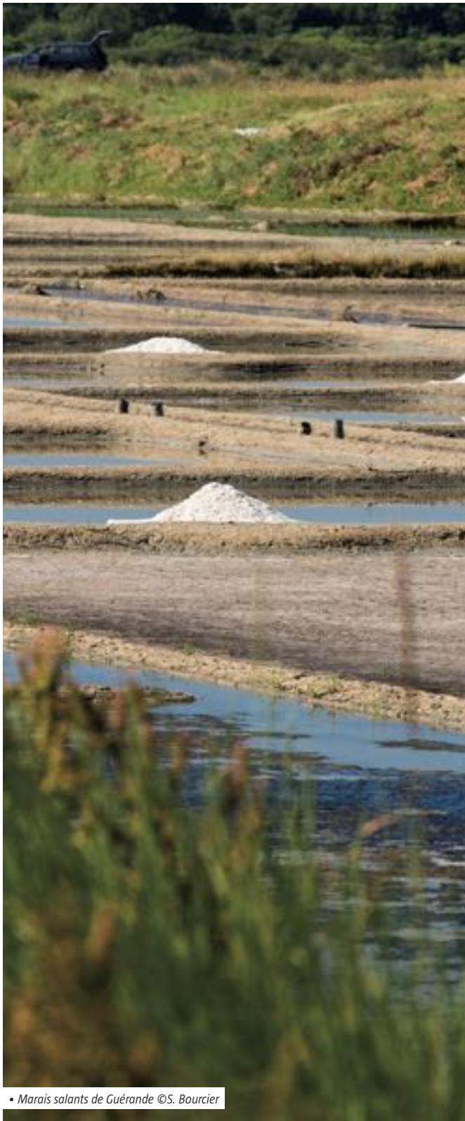
• Marais salants de Guérande

Les usages locaux qui s'exercent sur le site, ainsi que les actions dédiées à sa gestion et à sa préservation bénéficient de cette reconnaissance. Le label peut également permettre de faire évoluer certaines pratiques autour d'un projet qui encourage les usages respectueux des milieux humides.