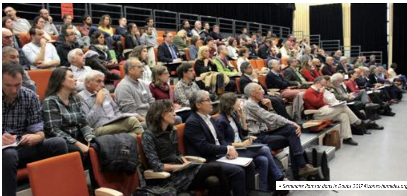
• Séminaire Ramsar dans le Doubs 2017

Le programme européen Interreg Itinérance aquatique fédère différents parcs naturels en France, Belgique et Luxembourg. Il a pour objectifs : la valorisation des milieux humides à travers des actions culturelles et touristiques destinées au grand public, la mise en réseau d'acteurs et de sites, la satisfaction des attentes des clientèles pour le tourisme de nature, la sensibilisation à ces milieux et à leur protection.