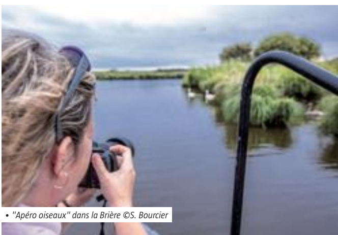
• "Apéro oiseaux" dans la Brière

Un livre réunissant photographies, iconographies, dessins et textes autour des visions sensibles du paysage permettra au site des Vallées de la Somme et de l'Avre de faire connaître le patrimoine local aux visiteurs et aux habitants.