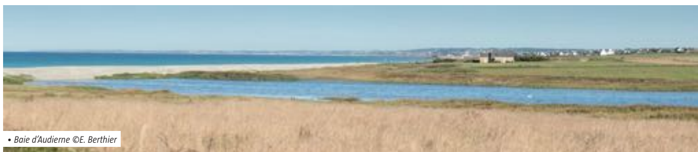
• Baie d'Audierne

Pool d'animations créé pour la JMZH : partenariat entre acteurs du site, sensibilisation des habitants, accueil de la journée de lancement de la JMZH.