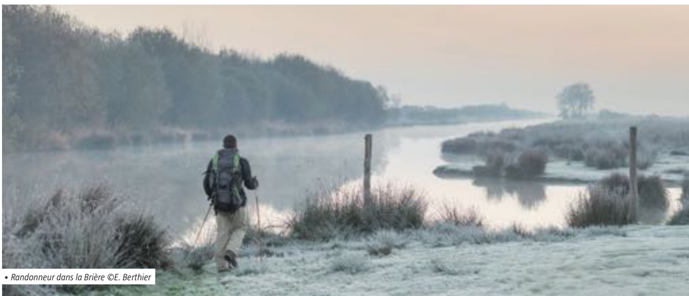
• Randonneur dans la Brière