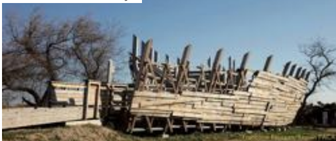
• Observatoire Horizons en Camargue

La reconnaissance internationale apportée par la labellisation met en lumière des territoires qui s'engagent en faveur d'un patrimoine naturel, à la fois cadre de vie de qualité et source d'attractivité pour des visiteurs .