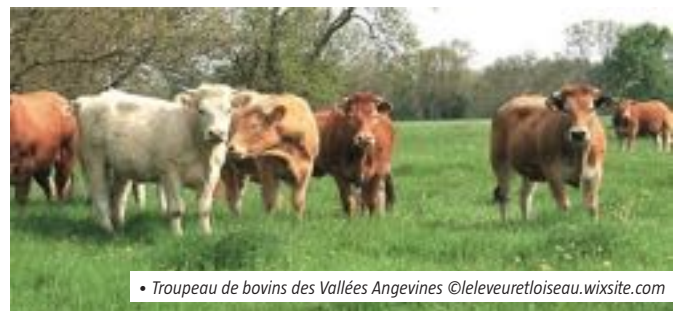
• Troupeau de bovins des Vallées Angevines

L'élevage extensif constitue l'activité majeure pour le maintien des milieux et des paysages. Les éleveurs y développent des pratiques de fauche respectueuses des oiseaux nicheurs et valorisent leur production de viande bovine à travers la marque « L'éleveur et l'oiseau - Le bœuf des Vallées » , en référence à la protection du rôle des genêts.