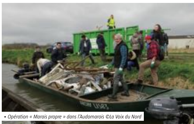
• Opération « Marais propre » dans l'Audomarois

Le Parc naturel régional des Boucles de la Seine normande anime le réseau des « Observ'acteurs » à destination des habitants, qui participent au suivi de la faune et de la flore.